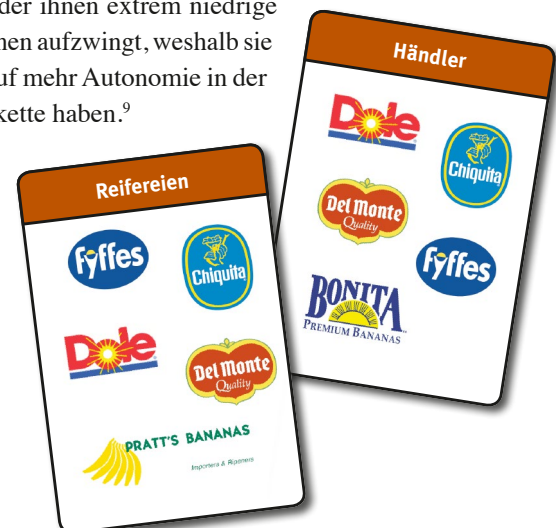
Hauptakteure im Geschäft mit Bananen

Bananen sind das zweitwichtigste Exportgut der dominikanischen Republik und eine wichtige Beschäftigungs-, Gehalts- und Einkommensquelle in ärmeren Regionen des Landes. 6 90 Prozent der Produzenten sind Kleinbäuerinnen und Kleinbauern (mit einer Anbaufläche von 1,2 bis 2,5 ha), sie erwirtschaften ca. 50 Prozent der Bananenproduktion des Landes. 7 Aufgrund der fehlenden Infrastruktur (Lagerung, Kühlung, Exportlogistik) für die empfindlichen und leicht verderblichen Bananen haben Kleinbauern nicht die Möglichkeit, selbst zu exportieren. Deshalb landen Kleinbauern für den Export ihrer Früchte bei privaten Exporteuren, die üblicherweise vertikal integriert arbeiten. Oftmals besitzen die Exporteure große Bananenplantagen, deren Erträge sie zuerst an ihre Kunden verkaufen. Kleinbauernkooperativen fungieren nur als Lieferanten von Pufferbeständen, egal wie hoch die Qualität oder wie wettbewerbsfähig ihr Angebot ist. 8 Ohne direkten Zugang zu Importeuren oder Marktinformationen bleiben Kleinbauernkooperativen oft in Abhängigkeit vom Exporteur, der ihnen extrem niedrige Handelskonditionen aufzwingt, weshalb sie kaum Aussicht auf mehr Autonomie in der Wertschöpfungskette haben. 9