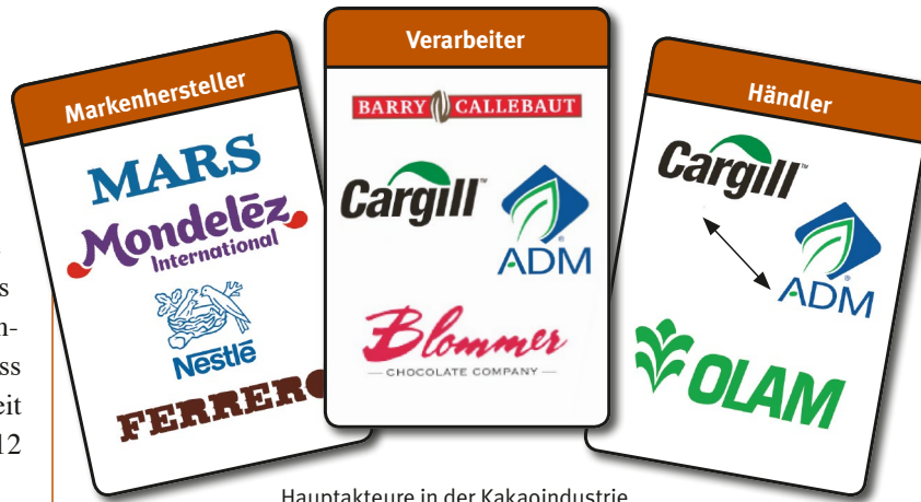
Hauptakteure in der Kakaoindustrie

Abgesehen von einigen Schweizer Konzernen stammen die mächtigsten Einzelhandels- und Nahrungsmittelkonzerne, die Hersteller von Agrarbetriebmitteln und Handelskonzerne aus den G7-Ländern. Um die Verletzungen von Arbeitsrechten von Plantagenarbeiter/innen und unfaire Handelspraktiken gegenüber Kleinbäuerinnen in globalen Produktketten zu verhindern, müssen die „Lead Companies“, also die mächtigen Konzerne in den Ketten, zu fairen Praktiken gegenüber ihren Zulieferern und zu Transparenz und Sorgfalt entlang der gesamten Zulieferkette verpflichtet werden. Hier sind die G7-Regierungen kollektiv gefragt. Auf der Agenda der G7 steht für 2015 das Thema „soziale Standards in Lieferketten“ – höchste Zeit sich gemeinsam auf konkrete Schritte auch für den Agrarsektor festzulegen.